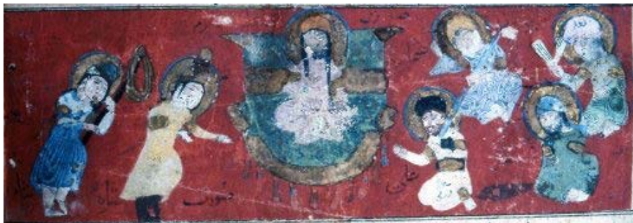
تصویر (۲) نگاره «پادشاه شام در محضر پیامبر (ص)»، نسخه ورقه و گلشاه، قرن ۶ هـ.ق، (موزه توپقاپی استانبول)