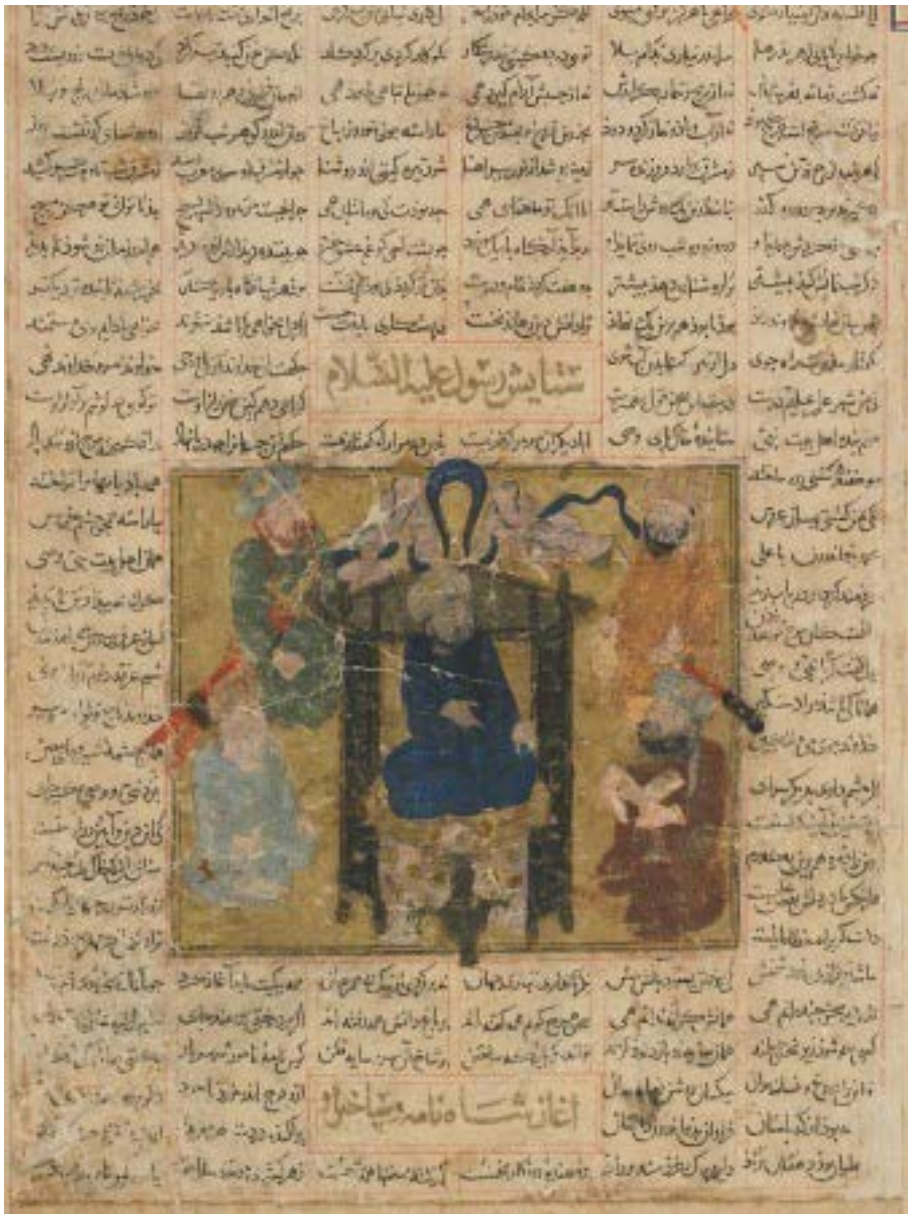
(تصویر ۳) نگاره «ستایش رسول (ع) »، نسخه شاهنامه، اوایل قرن ۱۴ م.

این نگاره از نسخه شاهنامه و مکتب شیراز، مربوط به سال‌های ۱۳۰۰ - ۱۳۵۰ م.